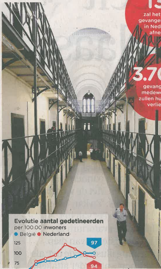
Evolutie aantal gedetineerden per 100.000 inwoners

"Tussen 1995 en 2005 steeg het aantal gedetineerden per 100.000 inwoners (de zogenaamde detentieratio) van 55 naar 137. In absolute cijfers gingen we van 8.000 naar 15.000 cellen. Binnen West-Europa hadden in 2005 enkel Spanje en het Verenigd Koninkrijk een hogere detentieratio dan Nederland." Ondertussen is die